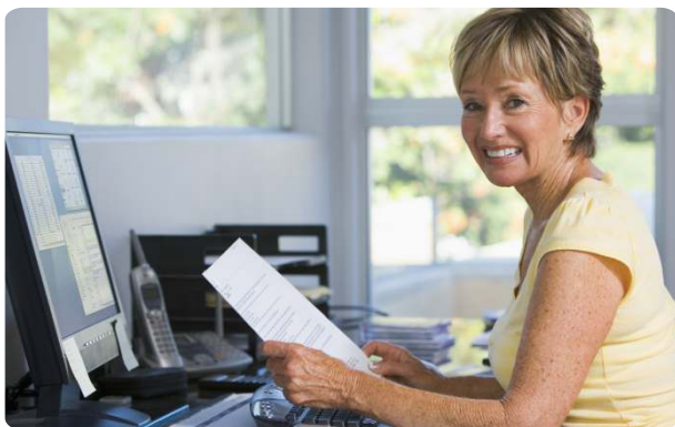
Keine Angst vor Viren, Spyware oder Trojanern: Sicherer und flexibler Zugriff auf alle Anwendungen ohne direkte IP-Verbindung ins Netzwerk.

Bei traditionellen Systemen, wie sie auch seitens der Rechenzentrale angeboten werden, ist die Öffnung des Netzwerks über VPN-Verfahren ein grundlegendes Sicherheitsproblem. Da nämlich jeder externe Client in das Netzwerk integriert wird, sind massive Sicherheitsvorkehrungen (intern sowie auch extern) erforderlich, um das Kompromittierungsrisiko wenigstens zu reduzieren. Vermeiden lässt es sich bei IPSec- und SSL-basierten VPNs kaum, da immer wieder neue Sicherheitslecks ("Vulnerabilities") auftauchen, die potentielle Angriffe ausnutzen können.